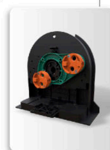
Joue de coffre avec connecteurs TWIN