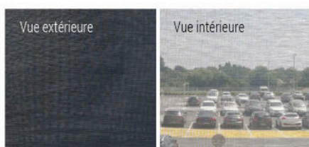
Toile Soltis 86 Noir Profond