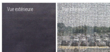
Toile Soltis 92 Noir Profond